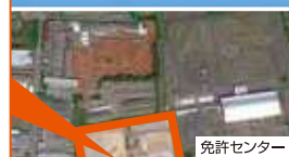
パークドーム熊本