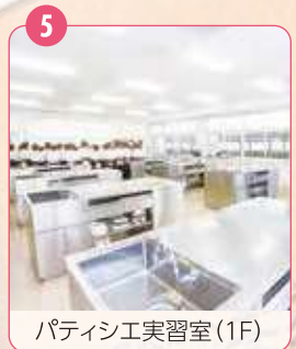
5 パティシエ実習室(1F)