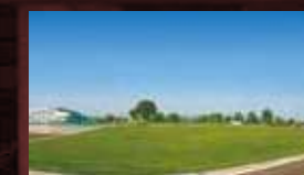
令和元年 菊陽総合 グラウンド完成