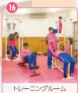
16 トレーニングルーム