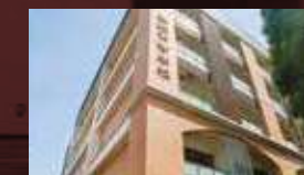
平成28年 第2号館竣工