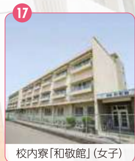
17 校内寮「和敬館」(女子)