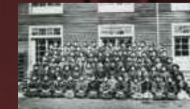
大正12年 職員と生徒