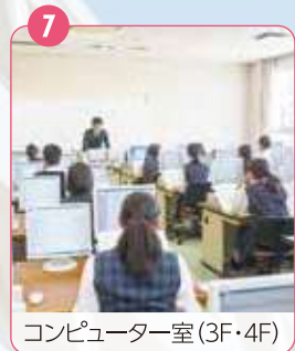
7 コンピューター室(3F・4F)