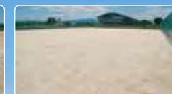
テニスコート(予定)