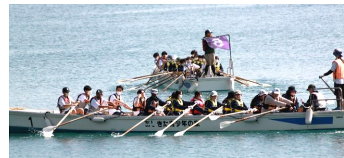
マリン活動/あしきた宿泊研修

和敬 1年生宿泊研修 英知 慶誠イブズム浸透 4月13日～15日に熊本県立あしきた青少年の家で1年生の宿泊研修が行われました。1泊2日で2班に分かれての実施でした。1班は、1・2・4・5組、2班は、3・6・7・8組でした。