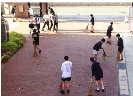
気持ちの良い清掃活動

本校では、各部活動生が早朝から掃除をしている姿をよく見かけます。楠が葉を散らし続ける5月1日の早朝、バスケットボール部員が校門付近を中心に掃き掃除を行いました。このように、校門一礼とともに、1日の始まりを