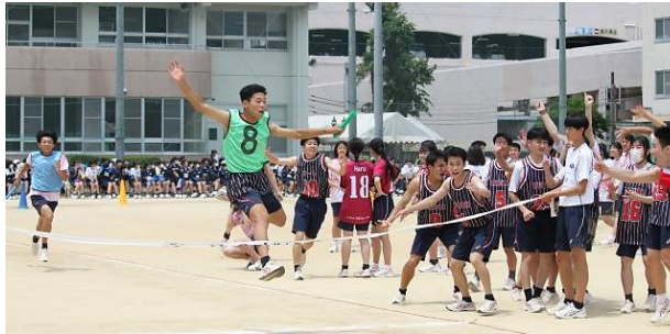
リレー決勝1位に歓喜する3年9組