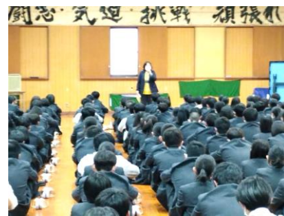
顔を上げて話を聞く2年生

学年集会 新学年がスタートし、4月12日に1年生の、13日に2・3年生の学年集会が行われました。